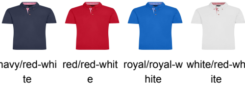
navy/red-whi te red/red-whit e royal/royal-w hite white/red-wh ite